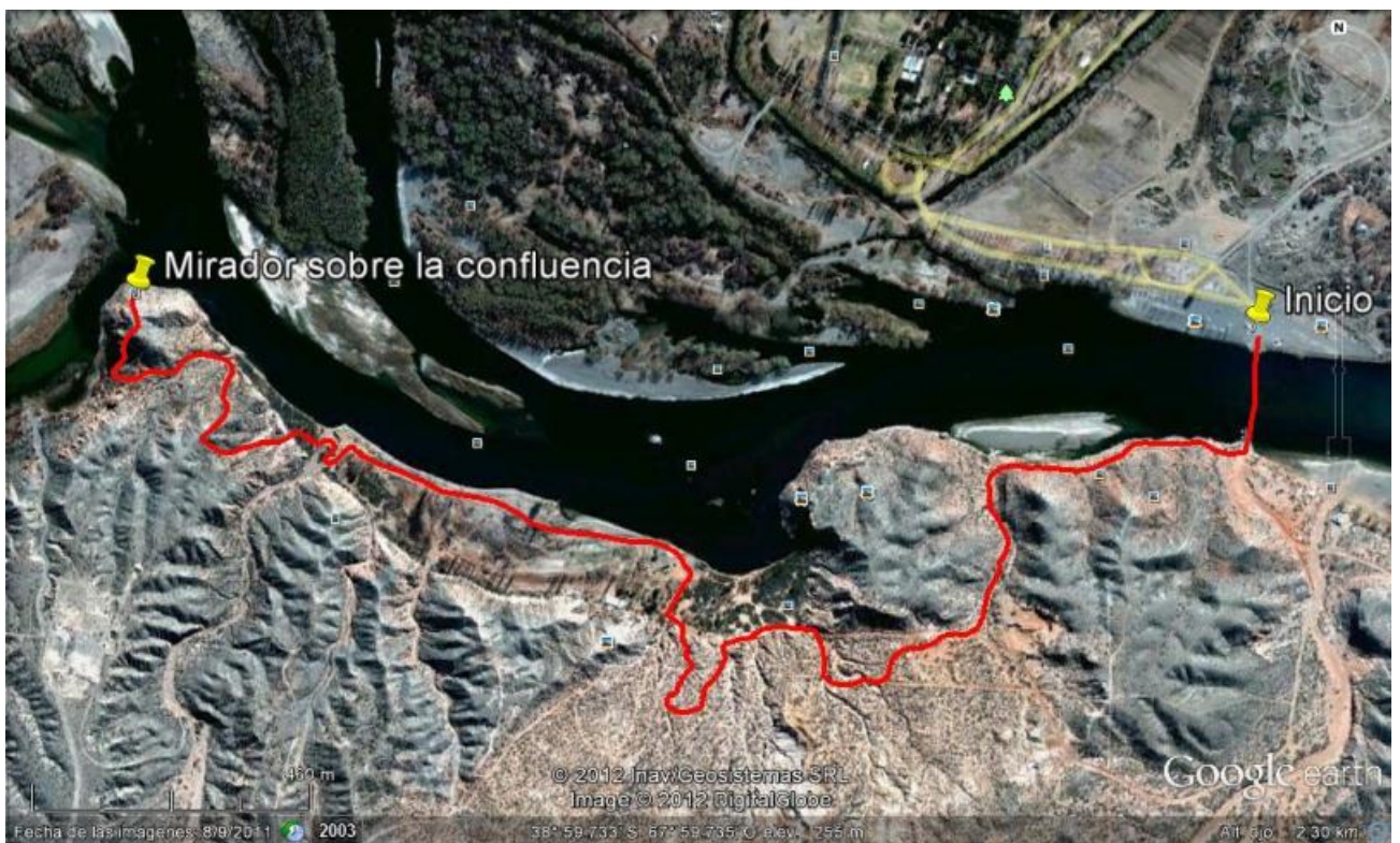
Imagen 1: Recorrido aproximado del Trekking a la Confluencia. Elaboración propia sobre foto satelital de Google Earth. (Fecha imagen 8/9/2011)