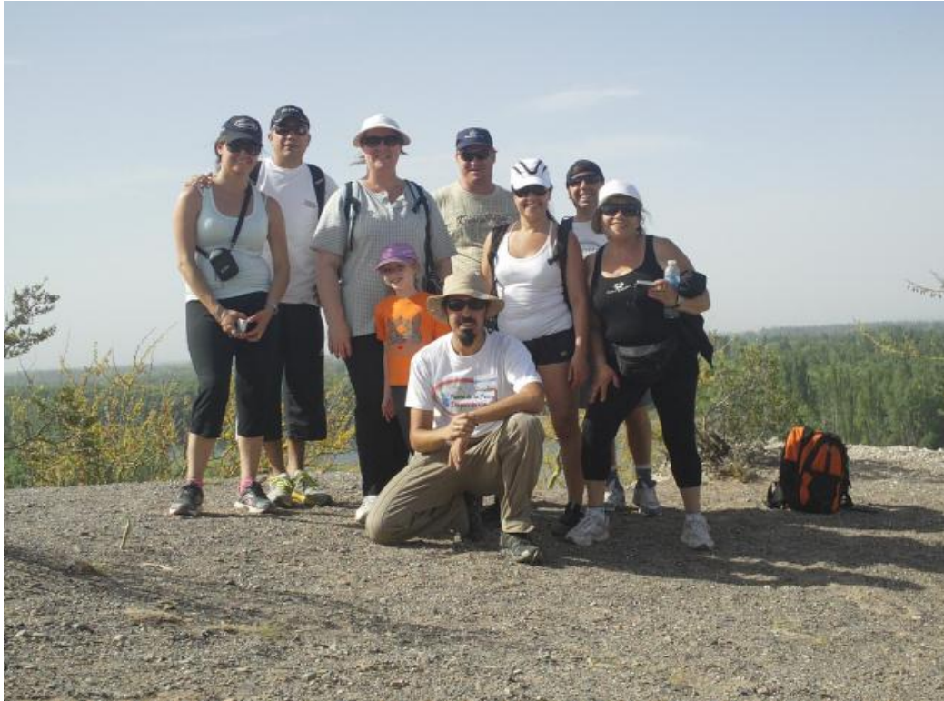
Foto 1: Grupo del 6º Trekking a la Confluencia en el Peñón Roca, sobre la zona de la confluencia. Diciembre 2011