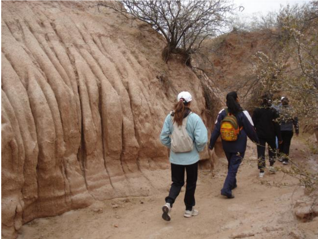
Foto 3: Parte del recorrido donde el grupo se adentró en los cañadones característicos de la región. Junio 2011