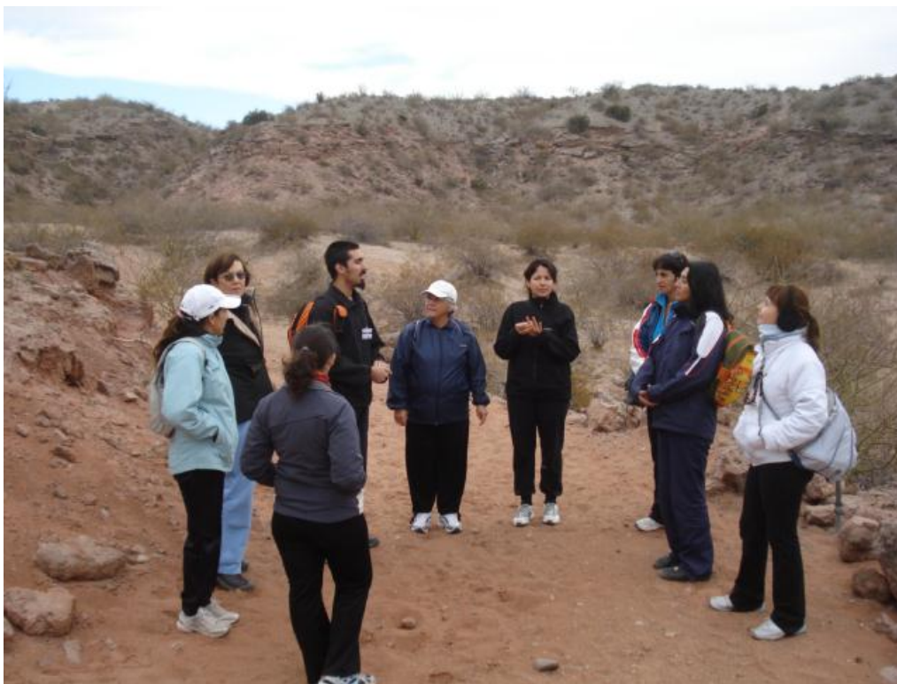
Foto 2: Charla interpretativa acerca de la historia geológica de la zona. Junio de 2011